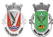
image001.jpg 9 KB