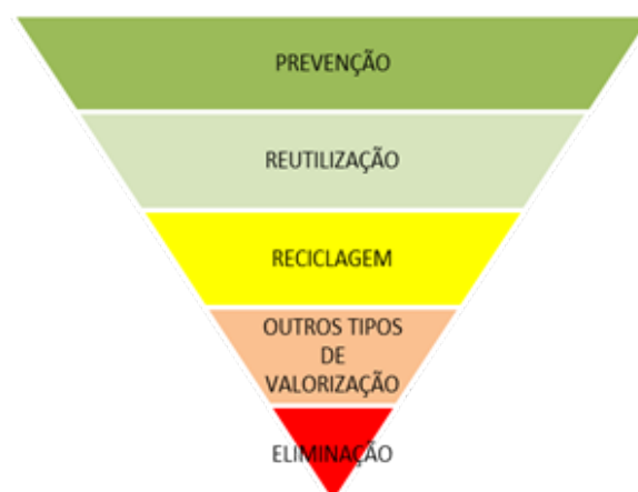
Fig.2 – Pirâmide ilustrativa do Princípio da Hierarquia da Gestão de resíduos