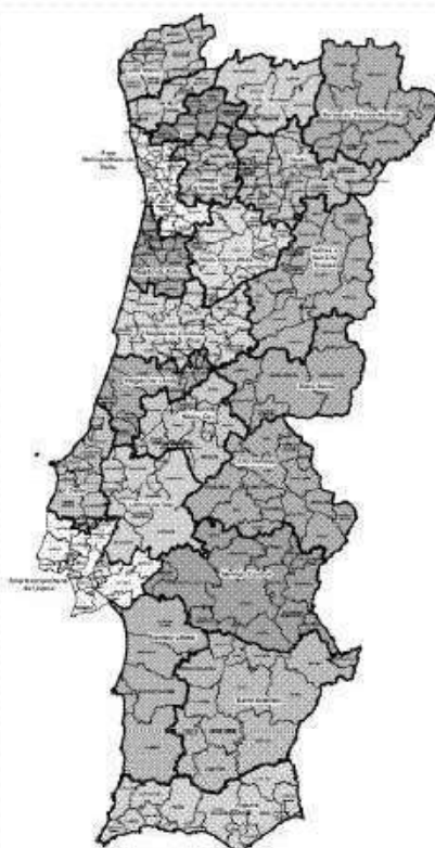
Mapa das Entidades Intermunicipais