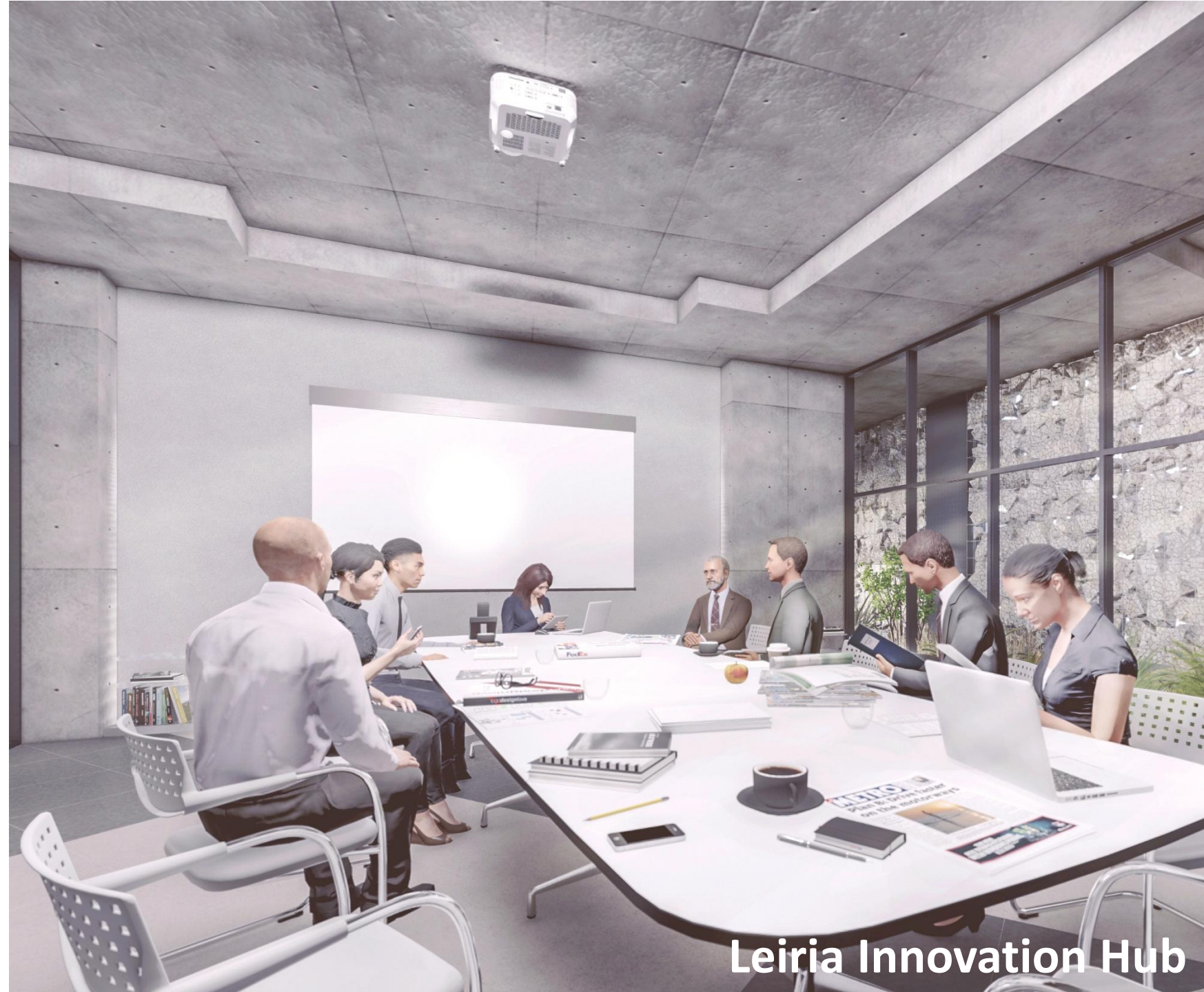
Leiria Innovation Hub