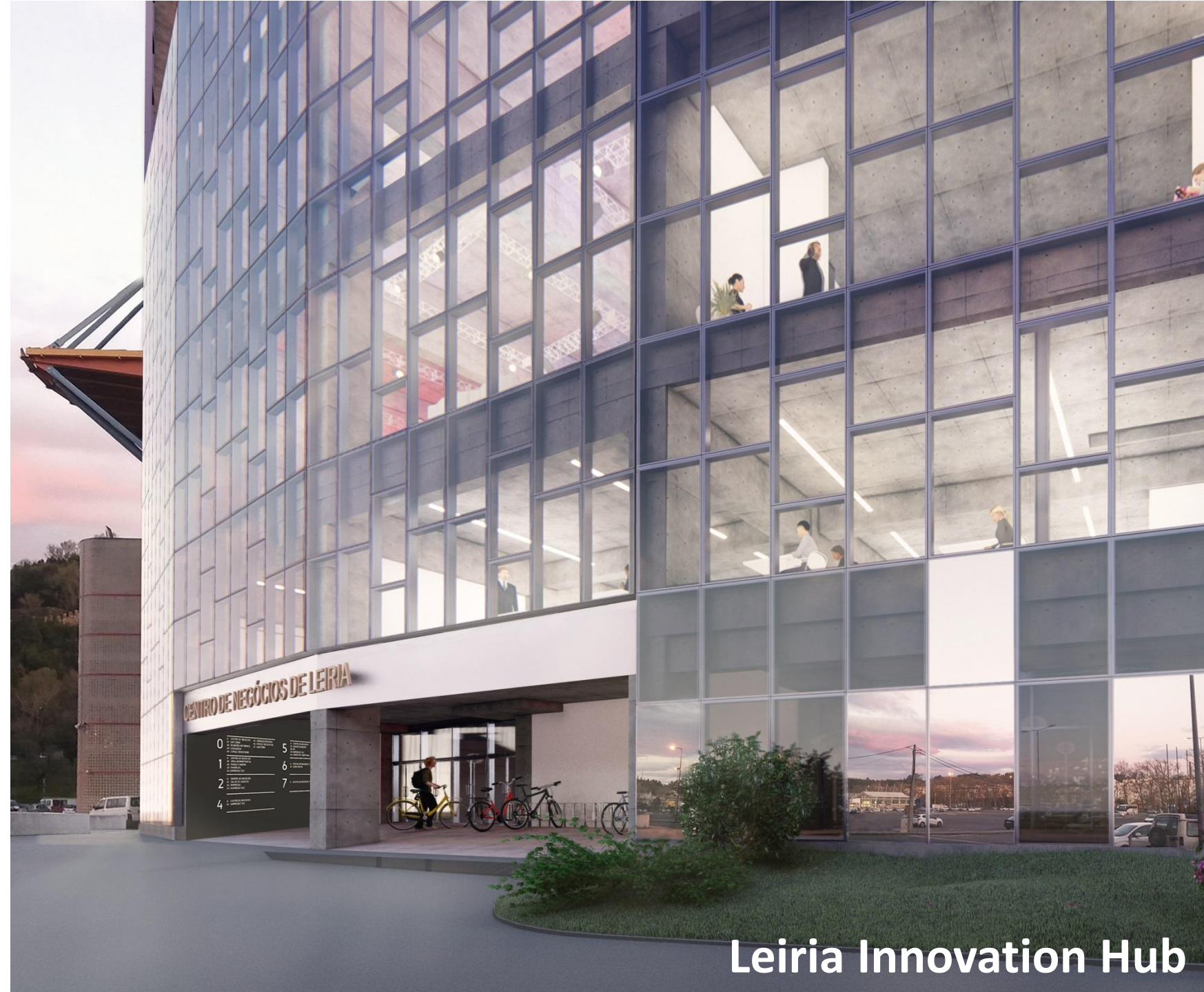
Leiria Innovation Hub

O foco do Projeto são as empresas das áreas das Tecnologias de Informação, Comunicação e Eletrónica (TICE) e os serviços do Estado e do Poder Local.