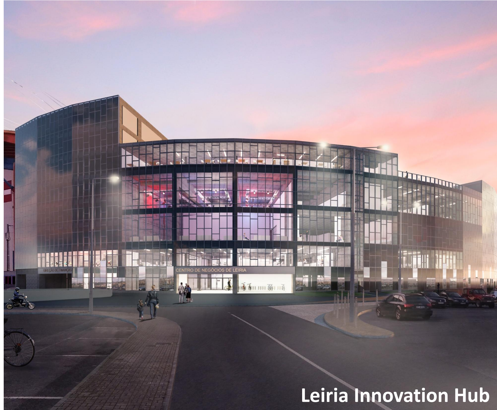
Leiria Innovation Hub