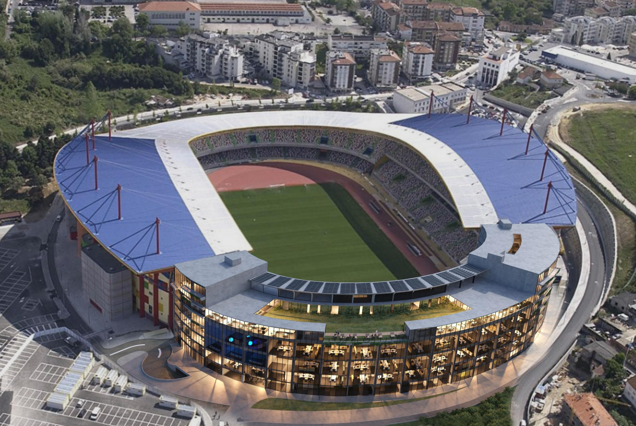
Leiria Innovation Hub