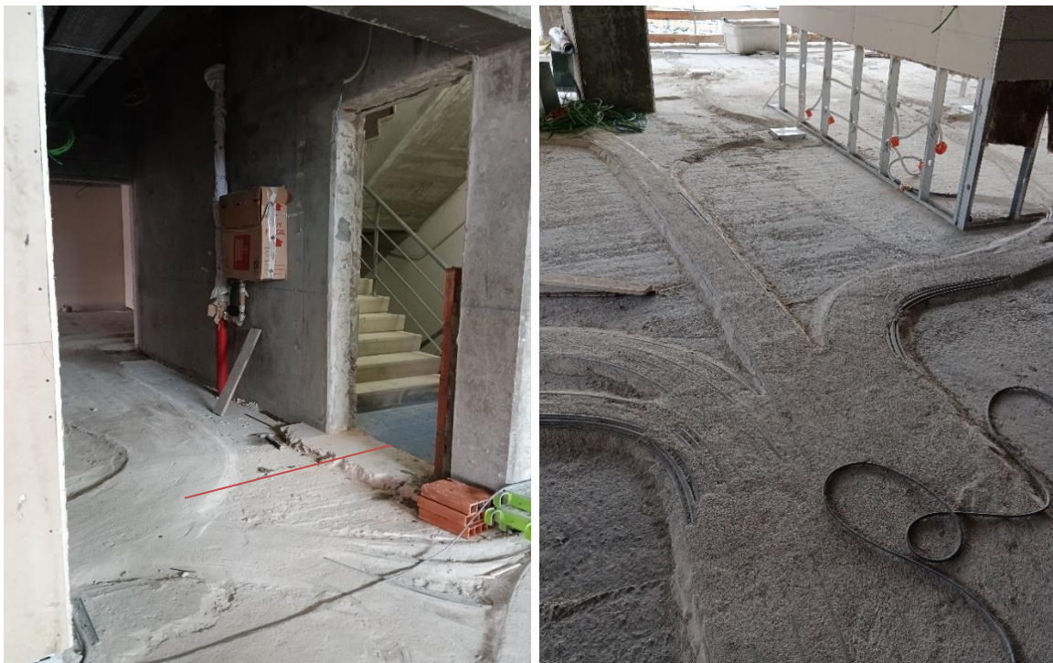
Entre o topo das infraestruturas e a cota do piso das escadas existe 1cm, insuficiente para o recobrimento