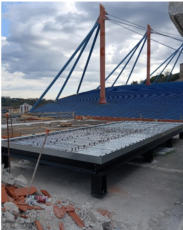
Estrutura de apoio da UTAN e Chiller