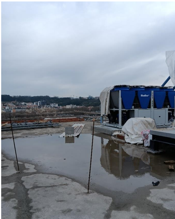
Base do Chiller