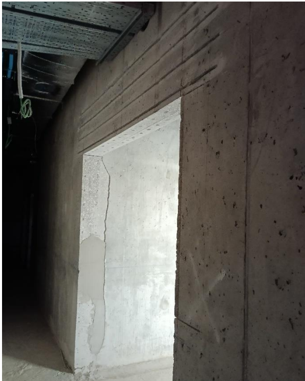
Abertura proveniente da demolição da parede de betão armado existente