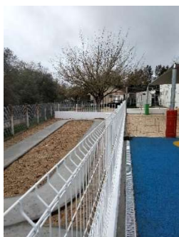
EB Correia Mateus

De seguida apresentam-se algumas fotografias, a título de exemplo da execução física no âmbito do presente contrato interadministrativo em algumas s Freguesias/União das Freguesias. 5