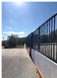
EB Mata Milagres