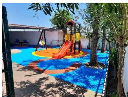
EB Souto do Meio