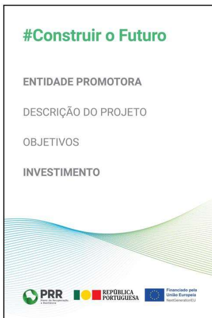
Modelo 2 - Dimensões - 100cm (L) x 150cm (A)