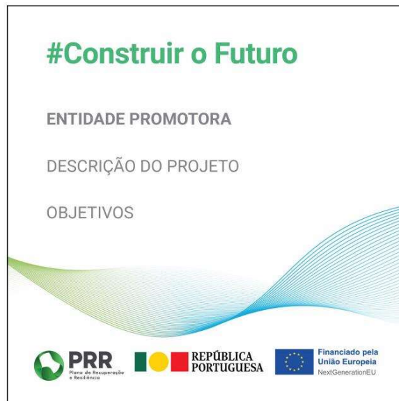
Modelo 3 – Formato 40cm (L) x 40cm (A)