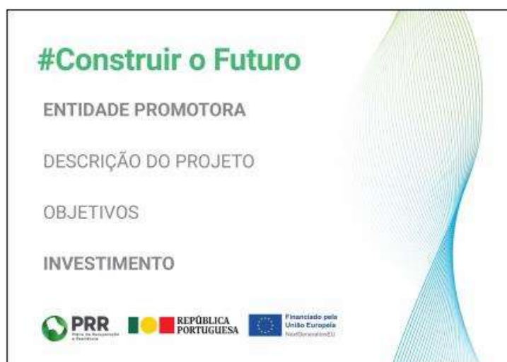
Modelo 1 – A3 ao baixo: 42 cm (L) x 29,7 cm (A)