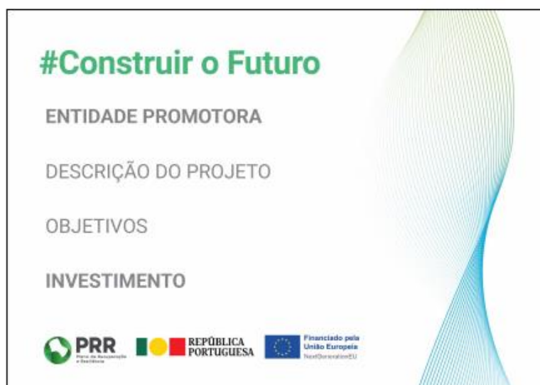
Modelo 1 – A3 ao baixo: 42 cm (L) x 29,7 cm (A)