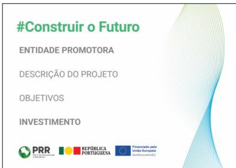
Modelo 1 – A3 ao baixo: 42 cm (L) x 29,7 cm (A)