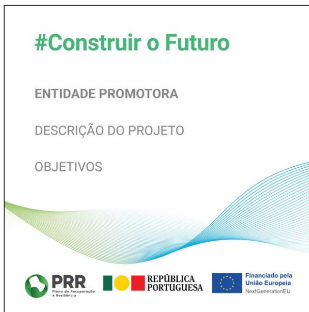
Modelo 3 – Formato 40cm (L) x 40cm (A)