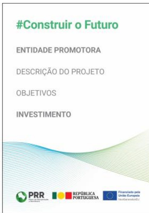
Modelo 1 - Formato A3 ao alto: 29,7 cm (L) x 42 cm (A)