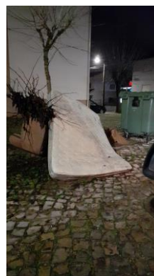
Figura 2: 13/12/2022

Nos termos da alínea q) do nº4 da cláusula 2ª (Serviços Principais) da Parte II (Cláusulas Técnicas) do caderno de encargos: