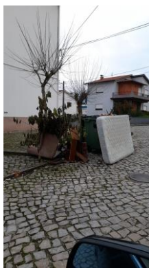
Figura 1: 03/12/2022