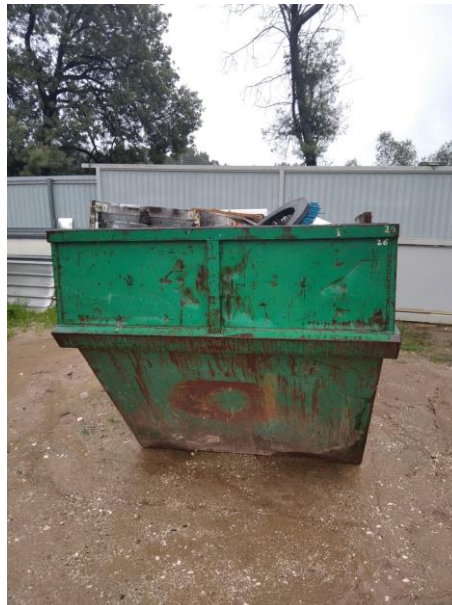
Figura 1 –Registo fotográfico de ausência de execução do serviço de recolha de monstros/objetos volumosos fora de uso, via contentorização de grande capacidade/multibenne , sita em Marrazes, em 17/11/22 (Fonte: União de Freguesias de Marrazes e Barosa).

Em 23/02/2023, a entidade EcoAmbiente veio, junto do Município de Leiria, pronunciar-se em sede de audiência prévia, em resposta ao ofício nº 8355, de 09/02/2023, remetido pelos serviços da Divisão de Ambiente e Desenvolvimento Sustentável, conforme: "Em resposta ao v/ ofício NIPG 63452/22 com v/ número de registo 2487 por nós rececionado em 09-02-2023, sobre a troca de o contentor multibenne, que se encontra no estaleiro, em Marrazes, informamos que o mesmo foi recolhido no dia 14-11-2022 e tem um histórico de recolha bimensal, conforme dados operacionais de 2022, mais foi monitorizado o seu nível de enchimento por forma a realizar o serviço assim que se justificasse, tendo sido efetuado novo levantamento às 12h:32m do dia 07-12-2022, pelo que, não podemos concordar com a vossa intenção em aplicar penalidade contratual. Termos em que, pelos factos, fundamentos e demais de Direito, se requer a V. Exas. que não seja dado provimento à aplicação das sanções previstas no ofício remetido por v. Exas. Ficamos ao v/ dispor para qualquer esclarecimento adicional."