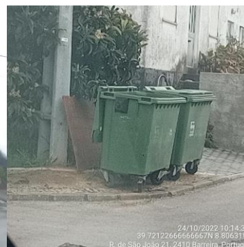
Figura 2: 24/10/2022

No seguimento dos factos descritos pela Divisão de Ambiente e Desenvolvimento Sustentável do Município de Leiria e constantes no registo 2022,INT,I,51,69832, evidenciando-se o incumprimento descrito, a Câmara Municipal de Leiria deliberou a intenção de aplicar à cocontratante Ecoambiente - Serviços e Meio Ambiente, S.A. a sanção pecuniária de 256,29€ (duzentos e cinquenta e seis euros e vinte e nove cêntimos) em virtude do incumprimento da obrigação de recolha e encaminhamento dos monstros depositados indevidamente na envolvente dos equipamentos de deposição de RU indiferenciados com a mesma periodicidade de recolha daqueles, através de meios específicos apropriados, no período de 20/10/2022 a 24/10/2022, incumprimento que constitui penalidade nos termos da alínea d) do número 1 da Cláusula 11.ª do capítulo III da Parte I (Cláusulas Jurídicas) do caderno de encargos do Contrato n.º 261/2021.