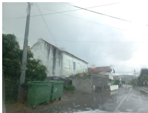
Figura 1: 20/10/2022