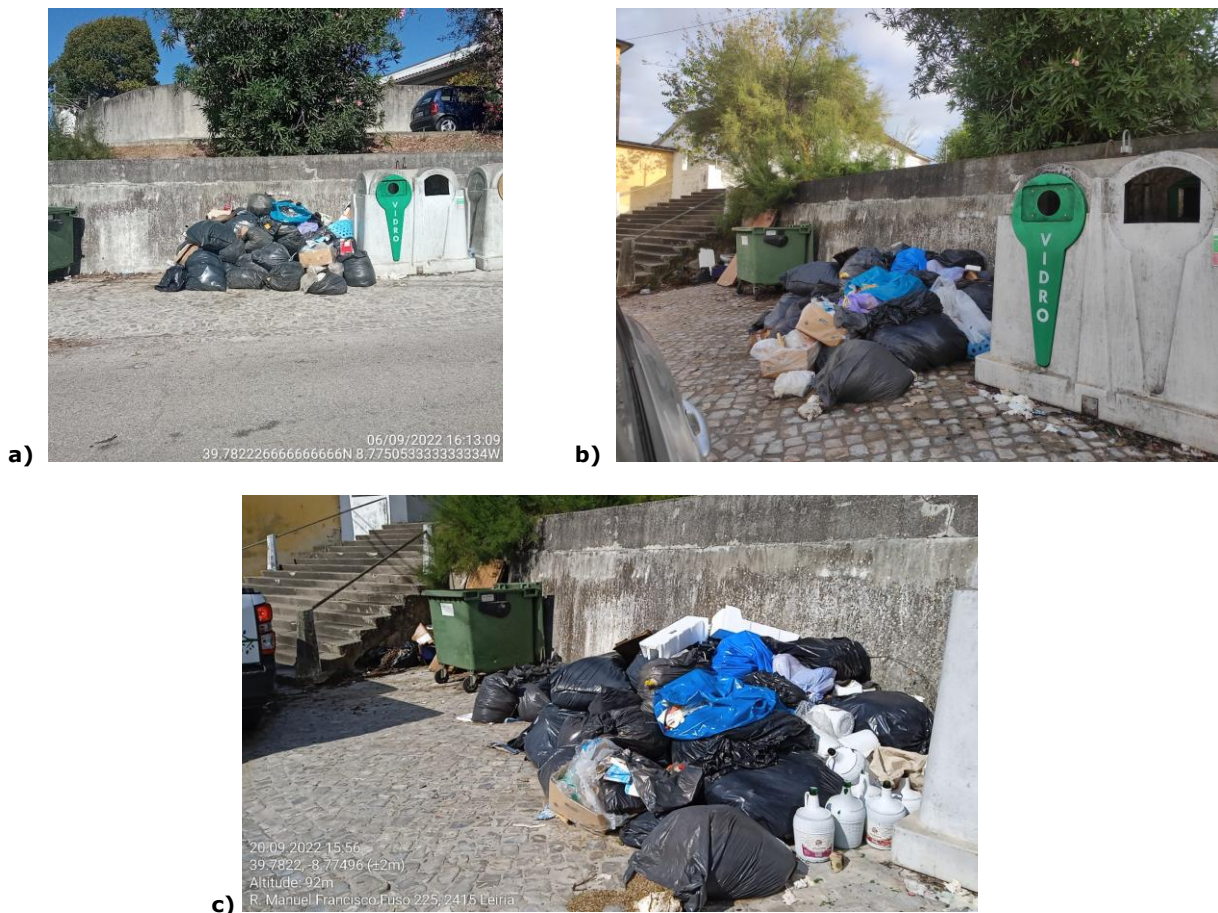
Figura 1 –Registo fotográfico de manutenção de ausência de remoção e limpeza dos resíduos indevidamente depositados na envolvente de contentorização de RSU, sita em em Rua José Jorge de Oliveira, localidade de Janardo, em: a) 06/09/22, 13h09 (Fonte: SMVA); b) 14/09/22 (Fonte: munícipe) e c) 20/09/22, 15h56 (Fonte: SMVA).

Findo o prazo para audiência prévia notificado à EcoAmbiente, pelo ofício n.º 5502, de 07/02/2023, e, até a presente data, não foi exercido pela mesma o seu direito de audiência prévia que lhe assistia. Deste modo, não foi apresentado pela EcoAmbiente quaisquer factos ou circunstâncias que possam alterar e inverter o seguimento da decisão de aplicar à cocontratante EcoAmbiente, a penalidade contratual de 151,47 € (cento e cinquenta e um euros e quarenta e sete cêntimos).