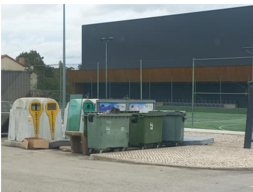
Figura 1: 20/10/2022