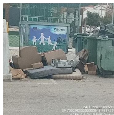
Figura 2: 24/10/2022

No seguimento dos factos descritos pela Divisão de Ambiente e Desenvolvimento Sustentável do Município de Leiria e constantes no registo 2022,INT,I,51,69833, evidenciando-se o incumprimento descrito, a Câmara Municipal de Leiria deliberou a intenção de aplicar à cocontratante Ecoambiente - Serviços e Meio Ambiente, S.A. a sanção pecuniária de 256,29€ (duzentos e cinquenta e seis euros e vinte e nove cêntimos) em virtude do incumprimento da obrigação de recolha e encaminhamento dos monstros depositados indevidamente na envolvente dos equipamentos de deposição de RU indiferenciados com a mesma periodicidade de recolha daqueles, através de meios específicos apropriados, no período de 20/10/2022 a 24/10/2022, incumprimento que constitui penalidade nos termos da alínea d)