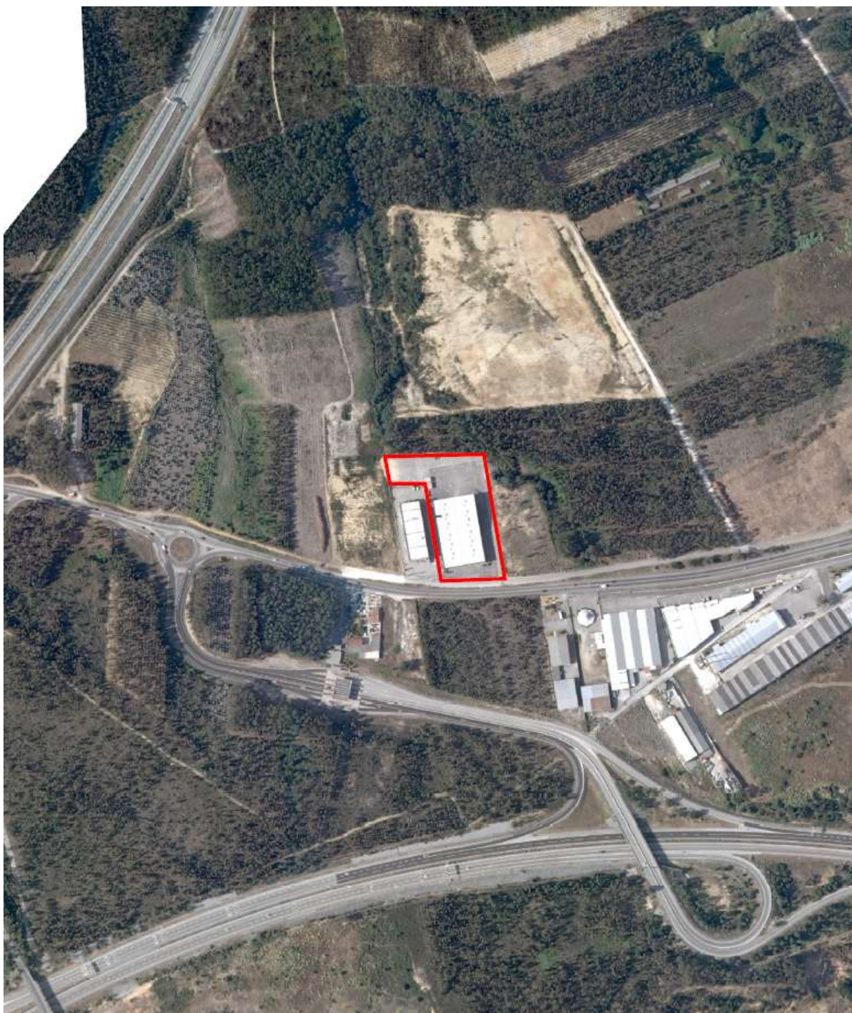
Figura. 2 – Localização do empreendimento estratégico sobre extrato de Ortofotomapa de 2018

No âmbito do pedido, o requerente apresentou argumentos de modo a justificar o reconhecimento do interesse público estratégico, designadamente: