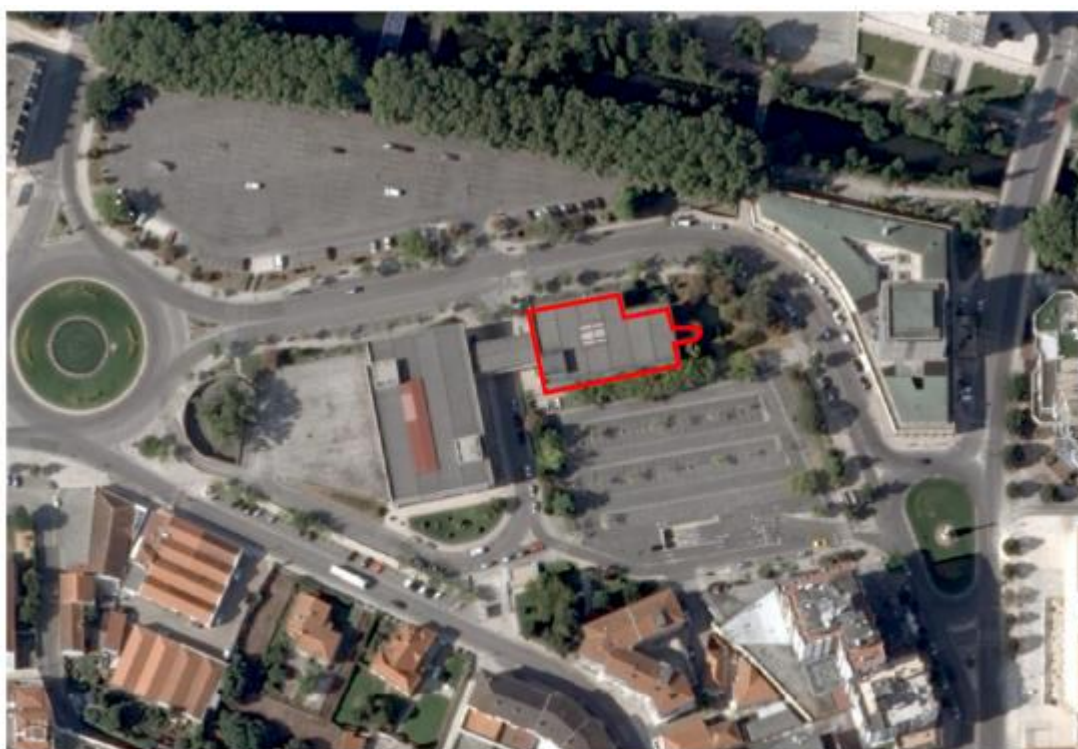
Figura 1: Localização do imóvel – Ortofotomapa de 2018