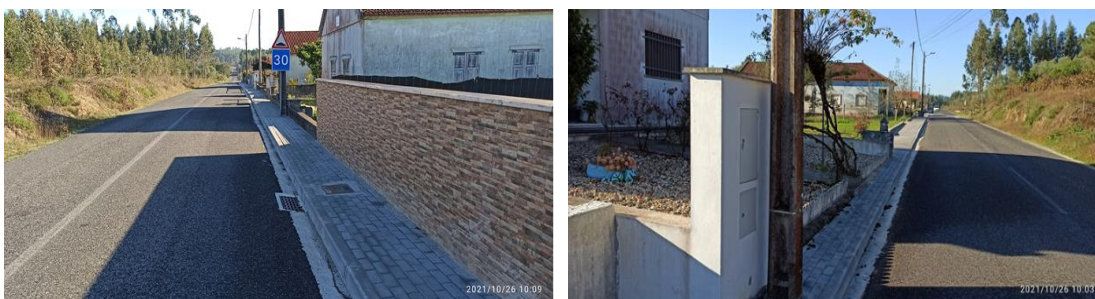
Figura 9 - Execução de passeios na Rua Colónia Agrícola dos Milagres e Rua Colónia- Milagres