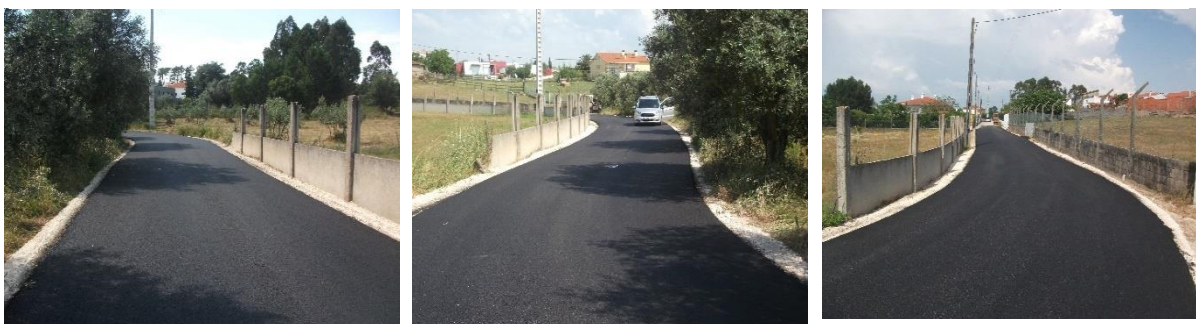
Figura 8 - Requalificação e beneficiação de arruamentos, Pocariça/Cavalinhos, Maceirinha