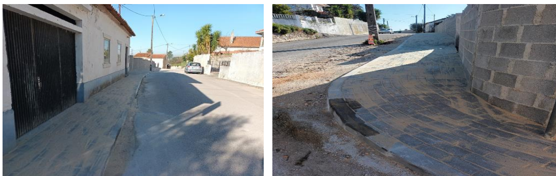
Figura 10 - Alargamento de diversos arruamentos, Regueira de Pontes