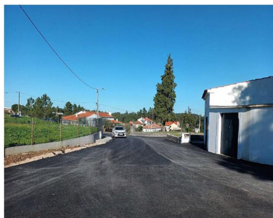
Figura 14 - Repavimentação da Rua do Cemitério, Arrabal