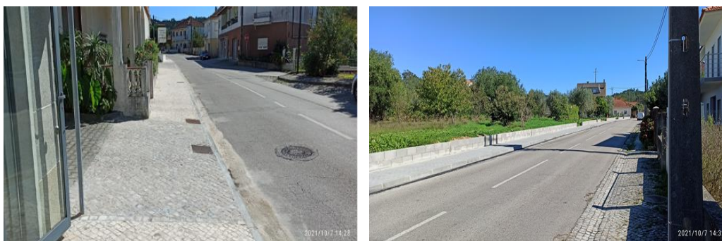
Figura 11 - Construção de passeios, Chã