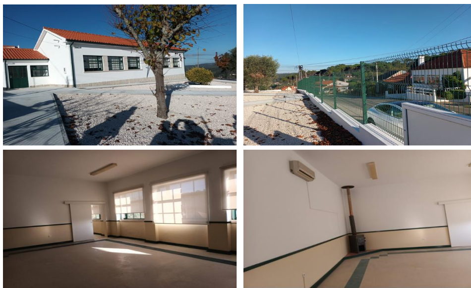
Figura 5 - Requalificação e remodelação da antiga Escola Básica de Souto de Cima