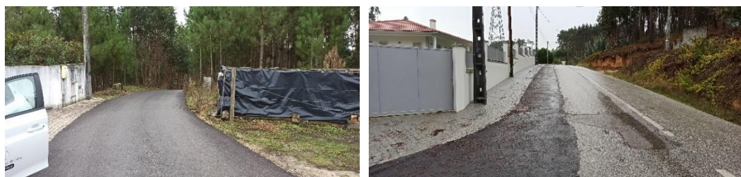
Figura 3 - Pavimentações de diversos arruamentos, Bidoeira de Cima