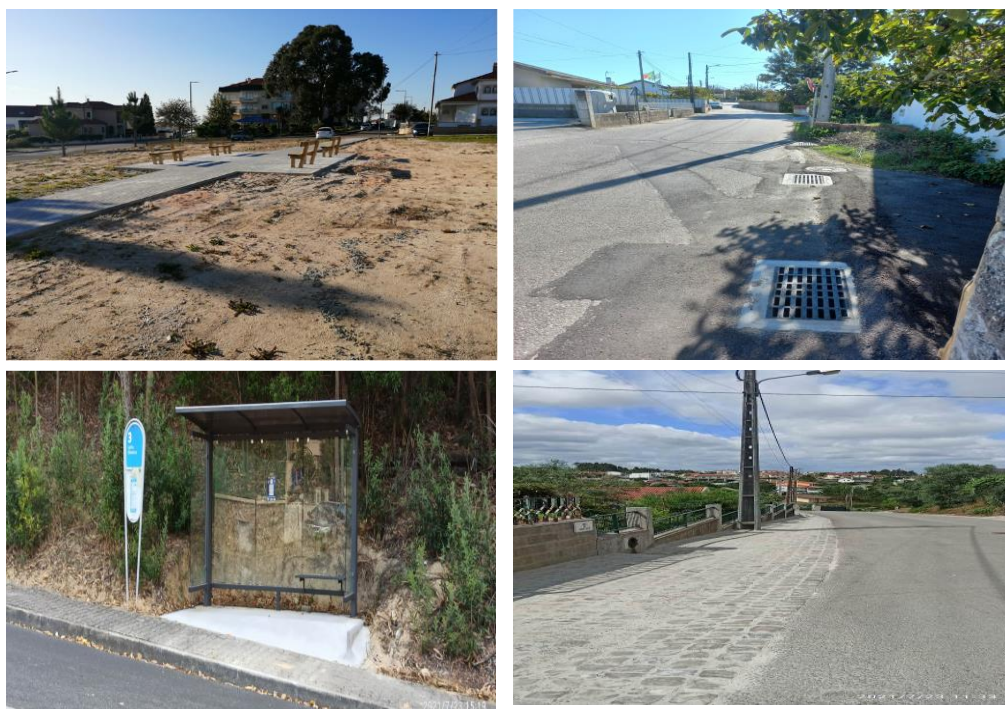
Figura 12 - Fornecimento e aplicação de abrigos de passageiros; Requalificação de bermas em calçada; Execução de parques infantis em Leiria