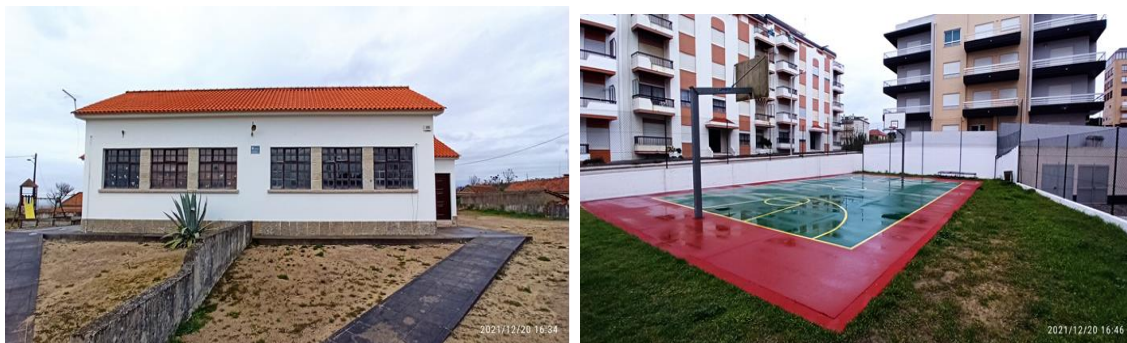
Figura 6 - Conservação da antiga Escola Básica do Praia do Pedrogão e da Escola Básica de Ervedeira e Requalificação de muro do parque de jogos da Praia do Pedrógão