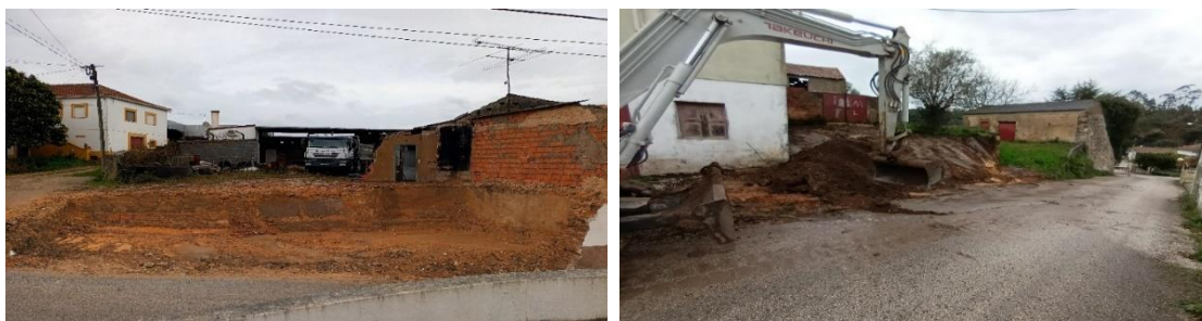
Figura 2 - Alargamento de via com demolição de habitação devoluta e construção de muro, Freixial