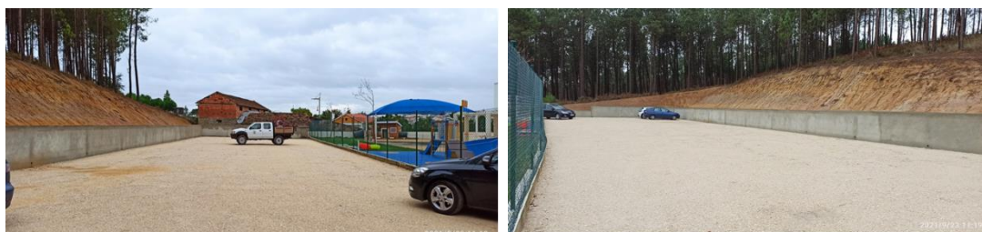
Figura 4 - Construção de parque de estacionamento adjacente ao Centro Escolar de Bidoeira de Cima