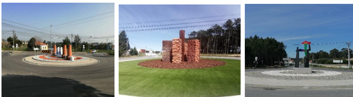
Figura 7 - Regularização e embelezamento da Rotunda da Venda, Rotunda da Cerca e Rotunda da Gândara