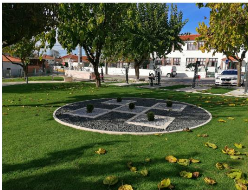
Figura 13 - Requalificação do Largo 30 de Junho, em Carreira