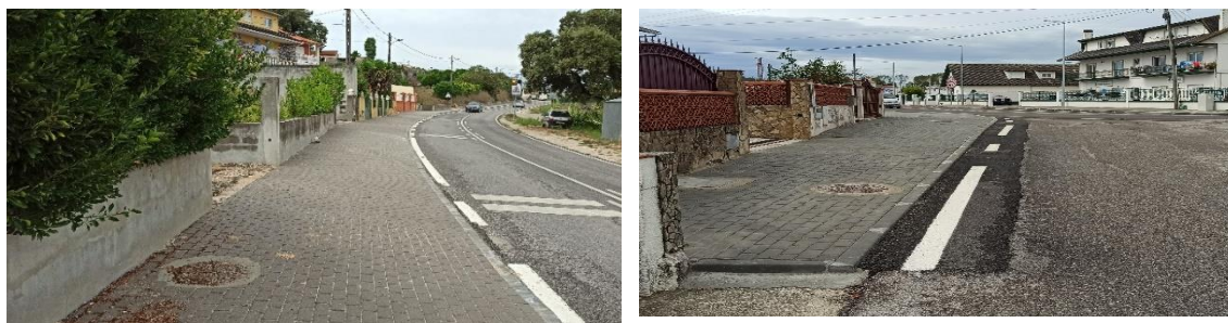
Figura 1 - Execução de passeios e drenagem, Barreiros