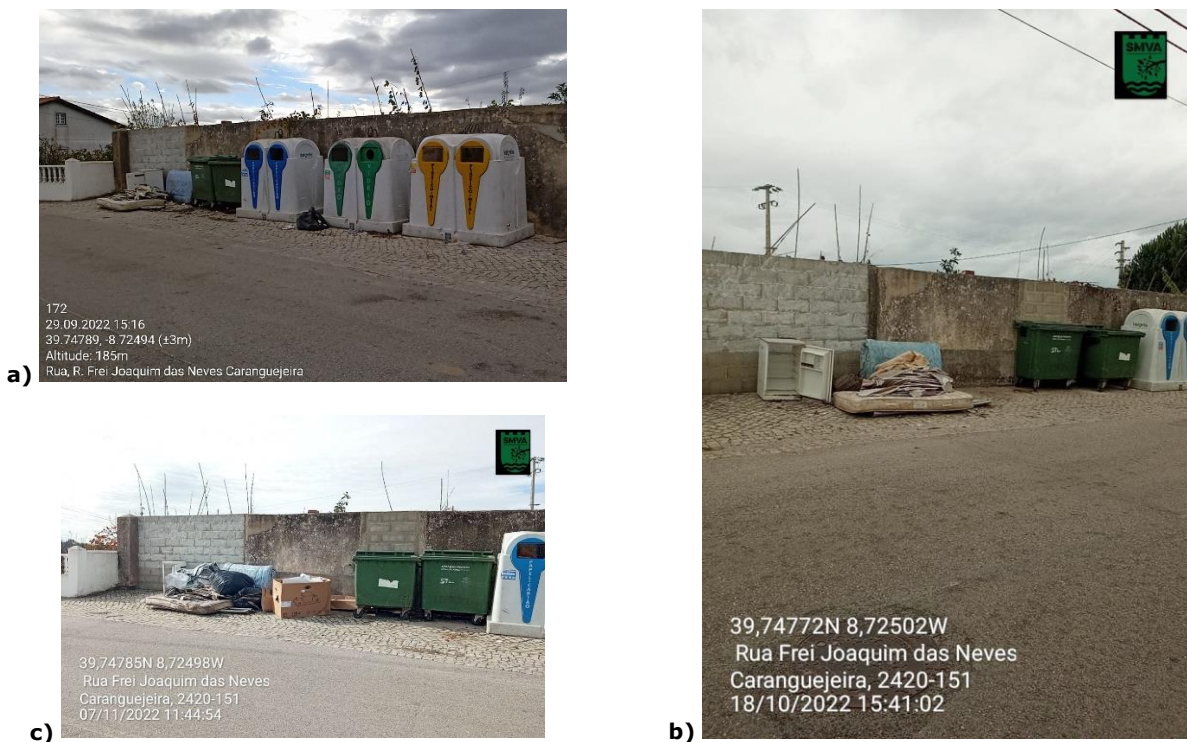
Figura 1 –Registo fotográfico da contínua ausência de recolha de monstros/monos , sita em na Rua Frei Joaquim Neves – Caranguejeira: a) Em 29/10/22; b) Em 18/10/22; c) Em 07/11/2022.

Em 11 de novembro de 2022, em deslocação ao local, o Serviço Municipal de Vigilância Ambiental confirmou a regularização da situação reportada.