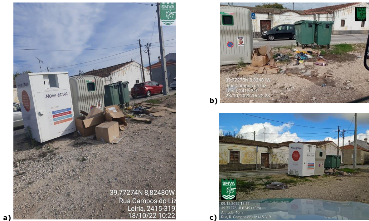
Figura 1 –Registo fotográfico de manutenção de ausência de remoção e limpeza dos resíduos indevidamente depositados na envolvente de contentorização de RSU, sita em Rua Campos do Liz, em: a) 18/10/22, 10h22; 28/10/22, 15h22 e c) 09/12/22, 13h57.

Divisão de Ambiente e Desenvolvimento Sustentável