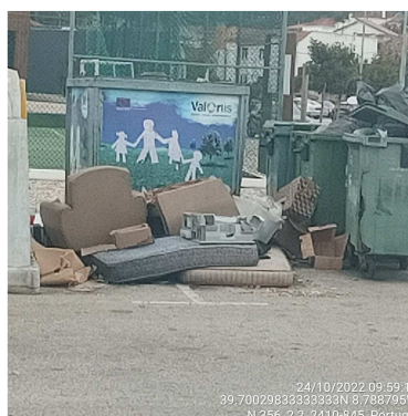
Figura 2: 24/10/2022

Nos termos da alínea q) do nº4 da cláusula 2ª (Serviços Principais) da Parte II (Cláusulas Técnicas) do caderno de encargos: