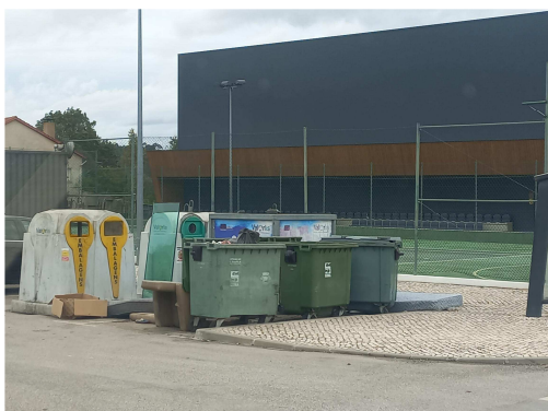
Figura 1: 20/10/2022