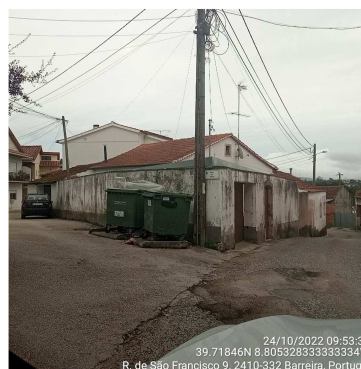
Figura 2: 24/10/2022

Nos termos da alínea q) do nº4 da cláusula 2ª (Serviços Principais) da Parte II (Cláusulas Técnicas) do caderno de encargos: