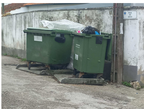
Figura 1: 20/10/2022