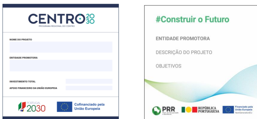
Modelo 3 – Dimensões – 40cm (L) x 40cm (A)