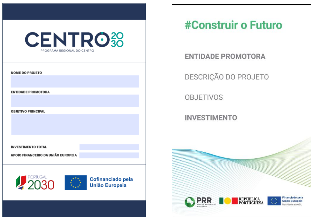
Modelo 2 – Dimensões – 200cm (L) x 150cm (A) ou 100cm (L) x 150cm (A)