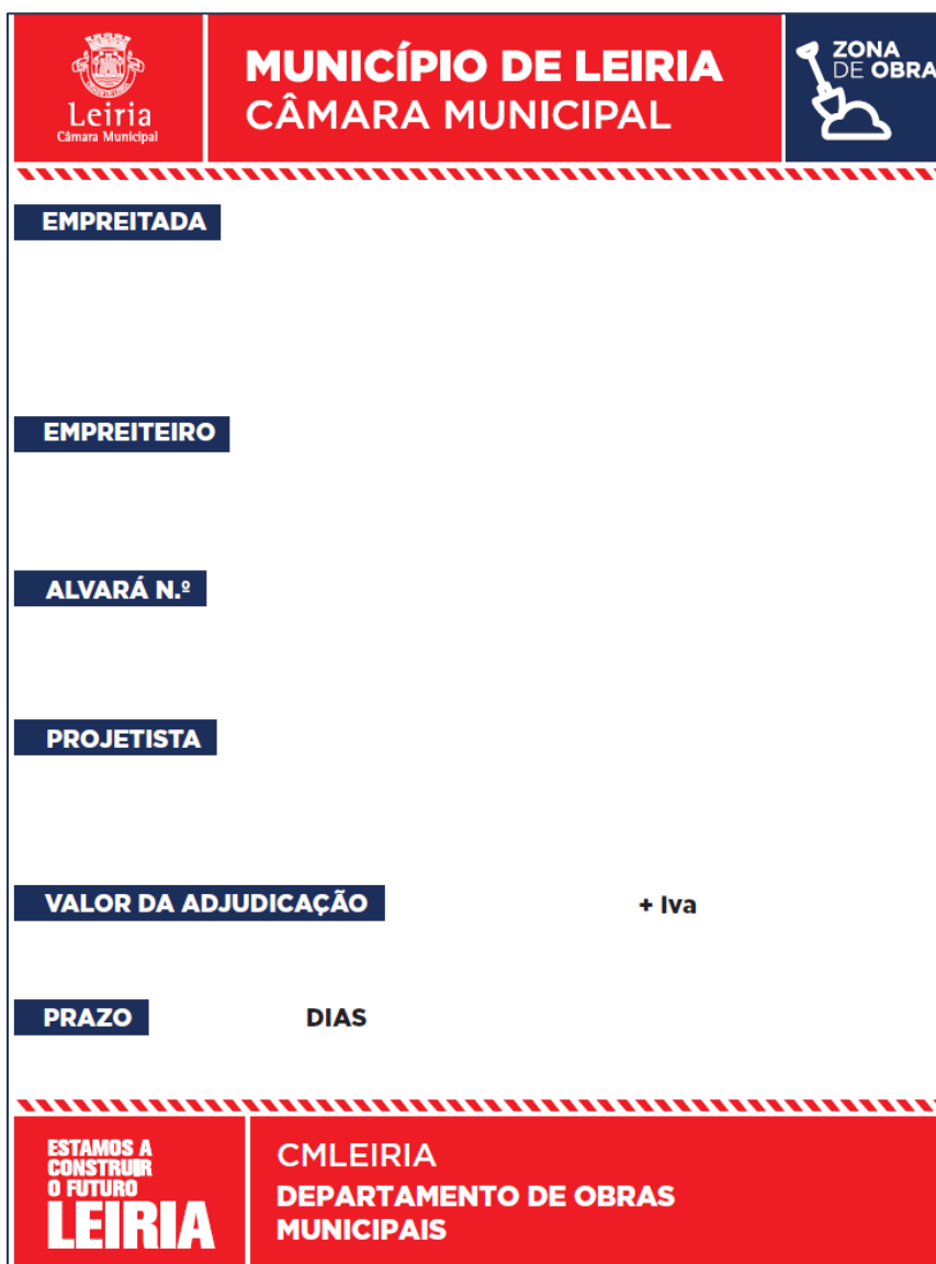
Modelo 1 – Dimensões – 150cm (L) x 200cm (A)