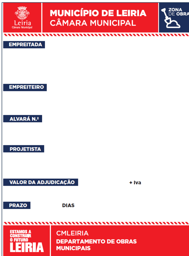
Modelo 1 – Dimensões – 150cm (L) x 200cm (A)