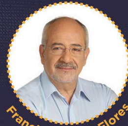
Francisco Moita Flores