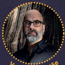
Valter Hugo Mãe